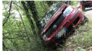
FOTO Esce di strada, finisce nel fosso e resta intrappolato nell'auto: salvato anziano

Rimini: in cinque al volante dopo aver bevuto, anche due neopententati